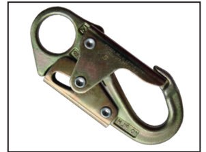
IKV 28 (ANSI Z.359.1-2007; CSA Z259.12-2011)