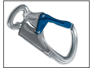
IKV 11 (EN 362:2004-T)